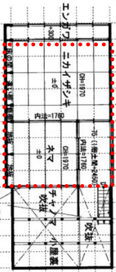
2階座敷 畳敷き和室 (15畳+8畳)